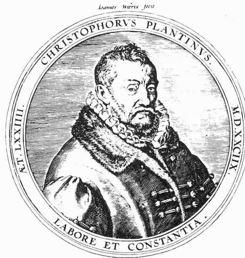
Christoffel Plantijn (1520 - 1589), portret door Johannes Wierix. Te zien in Antwerpen.

LEIDEN, Universiteitsbibliotheek: Vijftig jaar BNM in de Leidse UB. 1 - 30 mei 1989. Met begeleidend boekje.