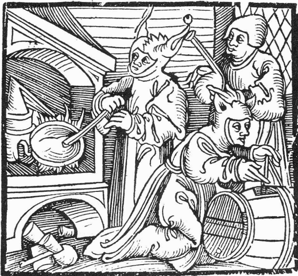
Alchemisten in hun werkplaats. In: Dat neye schip van Narragoniën, 1519. Te zien in Groningen en Zwolle.

ZERDOUN BAT YEHOUDA, M. Les papiers filigranés médiévaux: essai de méthodologie descriptive. Turnhout: Brepols, 1988. 272 pp., geïll. - Bibliologia, 7 -.